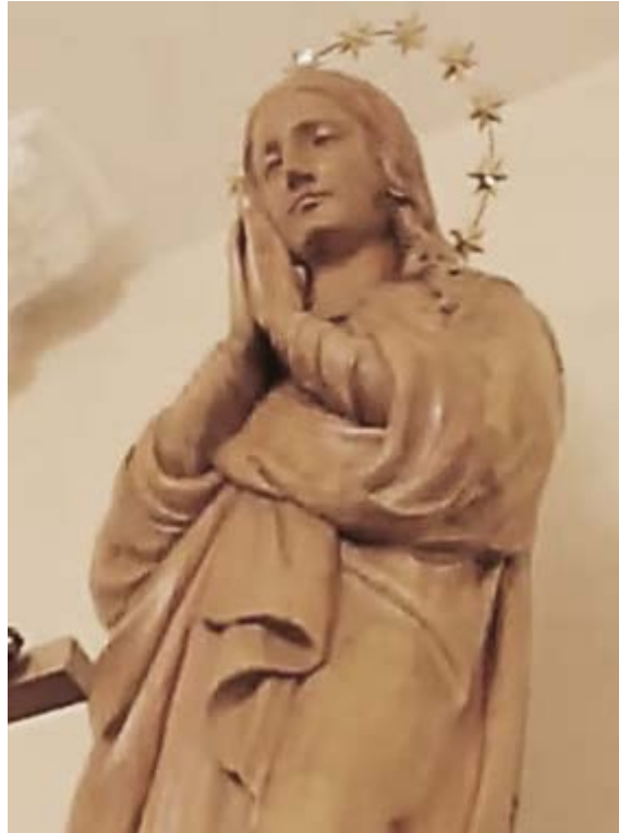
Statua di Maria Regina Apostolorum