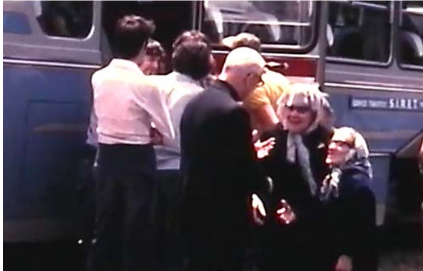
Vivaro, 1973. Pellegrinaggio con gli anziani

vincenziano. In quel momento il presidente nazionale delle Conferenze di San Vincenzo era il conte Bartolomeo Pietromarchi. Don Giorgio aveva studiato la figura di san Vincenzo de' Paoli e gli scritti. 36 Era quindi sulla stessa linea di "Monsieur Vincent". Niente pietismo. Nessuna ostentazione. Ma rottura di barriere.