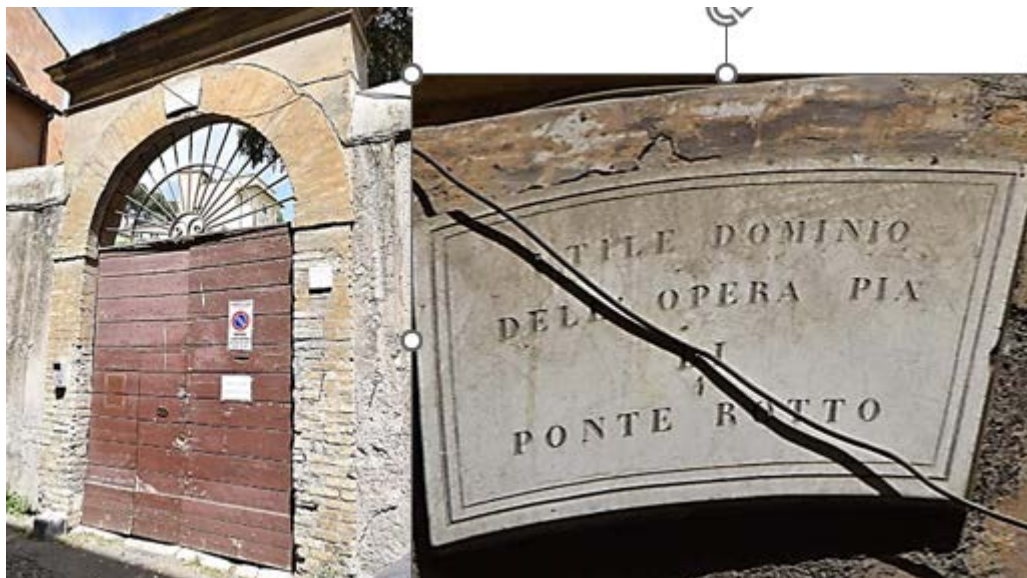
Proprietà dell'Opera Pia Santa Francesca Romana a Ponte Rotto

impresario teatrale. Supportato dalla regina, fece costruire il primo teatro musicale aperto al pubblico di Roma, il teatro Tor di Nona. La casa con giardino fu ristrutturata dal conte d'Alibert, e parzialmente modificata nelle forme attuali. In tale occasione venne realizzato anche un elegante casino con un giardino piccolo e rigoglioso.