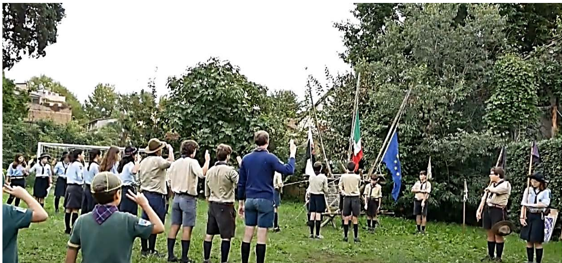
21 ottobre 2024; 80° del Gruppo Scout Roma 32

https://www.youtube.com/playlist?list=PLxD_J2aigj0qqa4RN3YWXmMteFSCNjuMv (Gruppo Scout Roma 32; periodo 1976-2023).