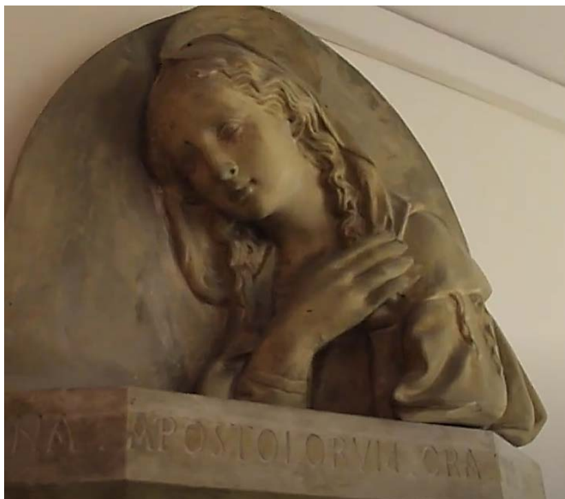
L'immagine di Maria posta all'ingresso e al 2° piano dell'O.R.A.