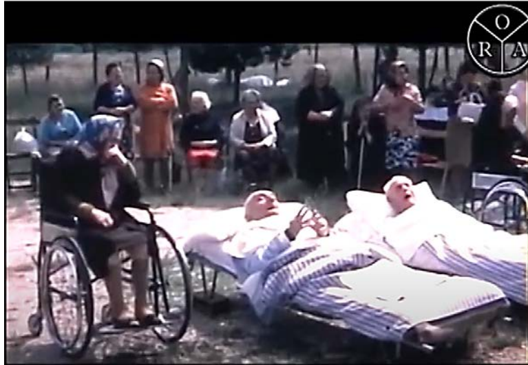
Tra i malati seguiti dall'O.R.A. (ricordando Lourdes) anche allettati e persone con problemi motori