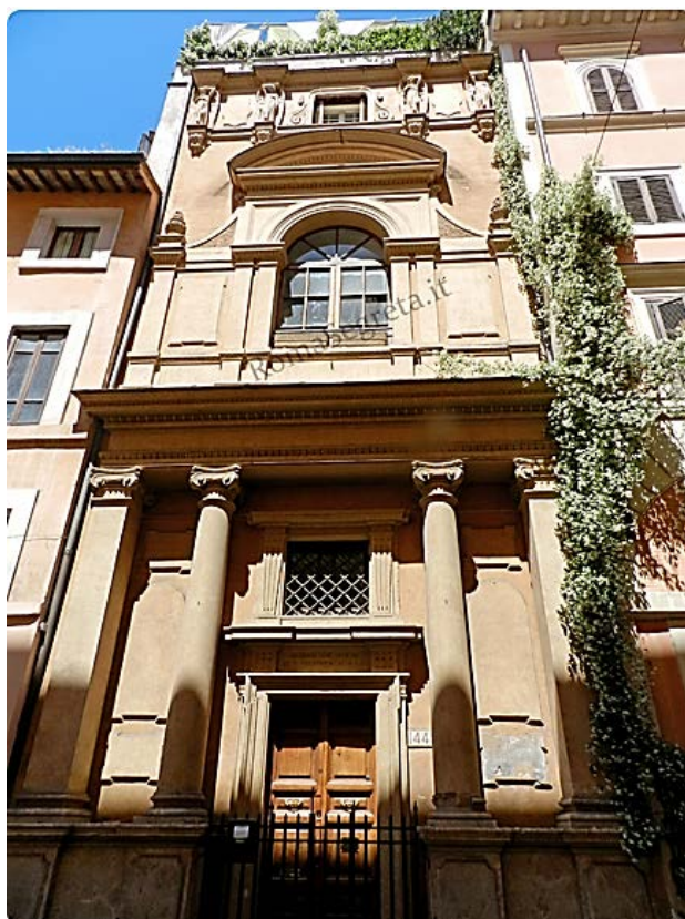
La sede dell’O.R.A. in via dei Baullari

La sede centrale dell’Opera Regina Apostolorum, via dei Baullari, Roma