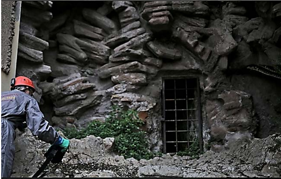
L'entrata del cunicolo che conduce al Gianicolo

usciti poco sotto il Gianicolo, al confine tra la Villa Lante e le mura vicine alla postazione ove ogni giorno, a mezzogiorno, è sparato un colpo di cannone.