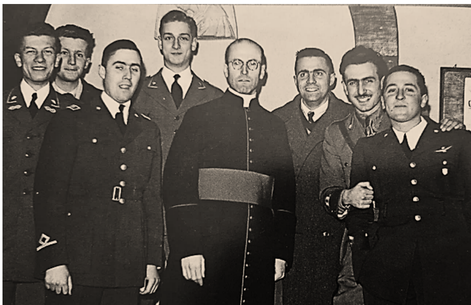
Congregati che partono per il fronte.