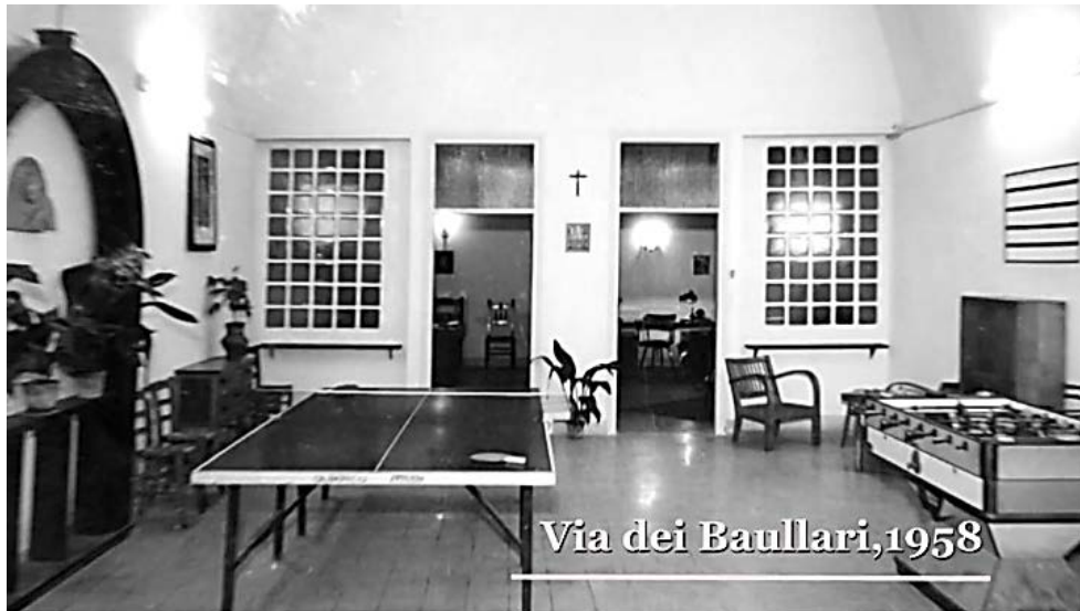
1958. La sede dell'O.R.A., via dei Baullari, 2° piano